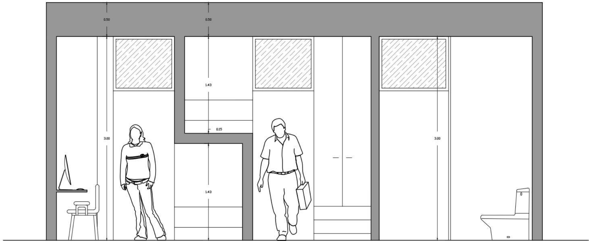
Corte vivienda compartida (doble) primera opción de 23m 2 Esc 1:35