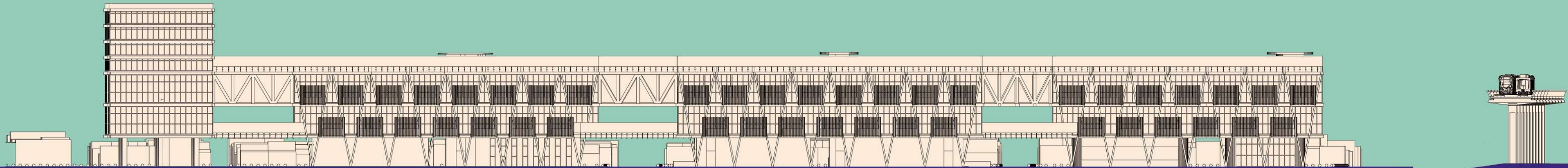
Fachada del Centro Psicológico y Psiquiátrico Esc. 1:500