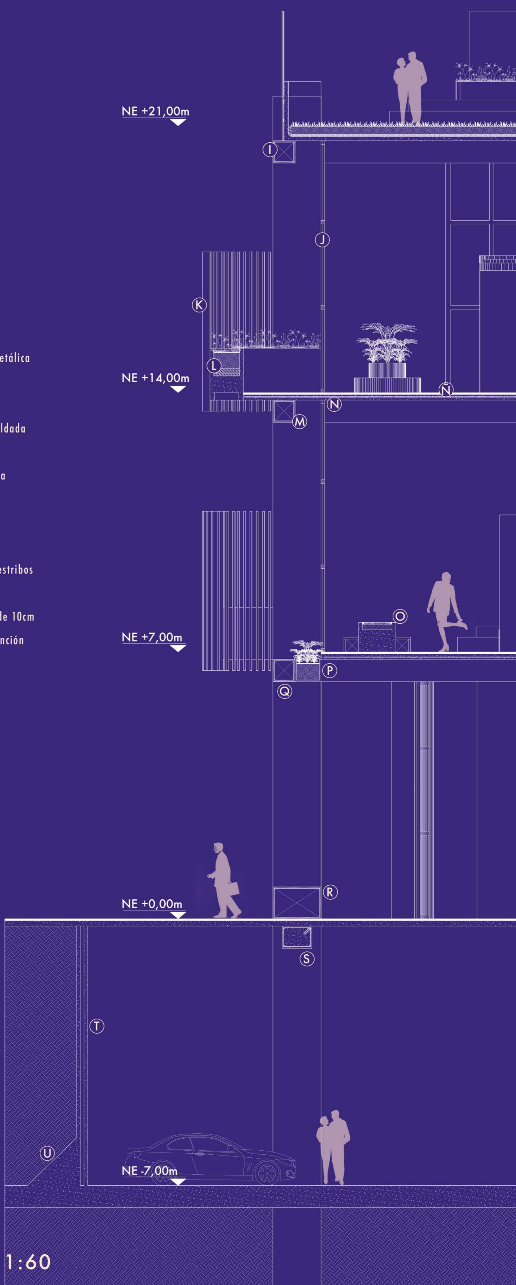
Corte por fachada Esc. 1:60